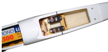
Servo D 200 BX BB/MG