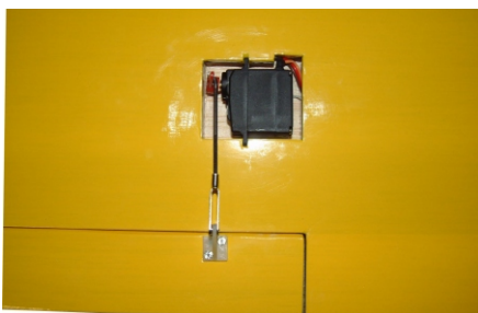
Servo D 200 BX BB